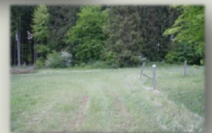
Krausbuchen 1, 2 und 3